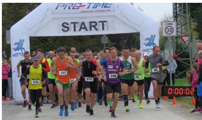
start 32. kostanjeviškega teka, oktober 2017

Proga je dolga 9 km. Start in cilj teka je pri Osnovni šoli Jožeta Gorjupa, Kostanjevica.